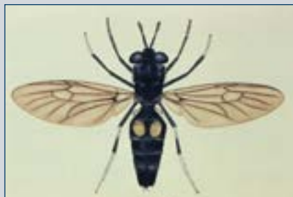
Рисунок 12. Кормовая муха.