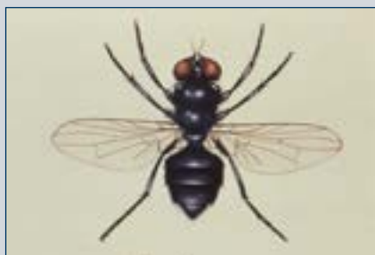
Рисунок 10. Мусорная муха.