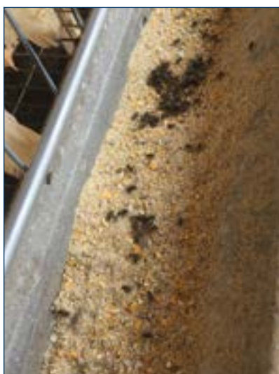
Рисунок 8. Мухи привлечены к корму. Это снижает эффективность кормления стада и увеличивает риск заражения.