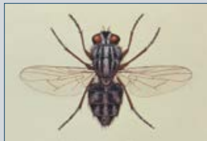
Рисунок 13. Муха-жигалка.