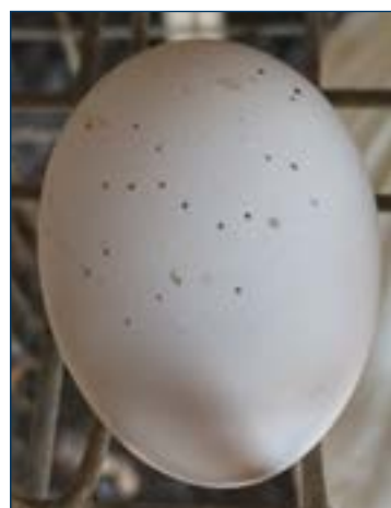
Рисунок 7. Яйцо, на котором есть большое количество пятен, оставленных мухами, указывает на наличие проблем, связанных с мухами.

Ловушки для мух можно повесить на проволоку или положить на пол в навозной яме. Ловушки следует проверять, а приманку заменять не реже одного раза в неделю. Для установки и смены ловушек