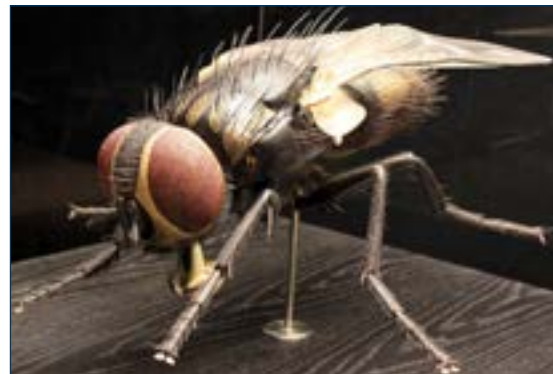
Рисунок 1. Комнатная муха.

Заражения посредством насекомых являются серьезной проблемой для птицеводства. Сконцентрированный в помётохранилище, в помещениях для содержания птицы или на настилах, птичий помет является идеальным средством для размножения мух. Большие популяции мух могут вызывать дискомфорт, стресс и снижение продуктивности у несушек, молодок и племенной птицы. Мухи также являются источником болезней птиц и человека. В крайних случаях, несоответствующий контроль мух может привести к плохим отношениям с общественностью или даже к судебным разбирательствам. Контроль и профилактика насекомых необходимы для успеха в выращивании и продуктивности несушек.