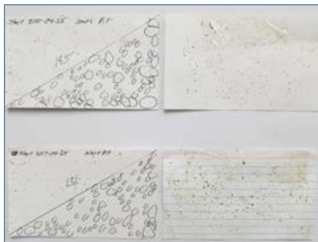
Рисунок 6. Примеры карточек с пятнами, оставленными мухами из помётной ямы. Дата, местоположение и количество пятен отмечены на карте спереди.

потребуется больше затрат, чем для специальных карточек, но они убивают мух и позволяют идентифицировать их виды.