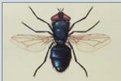
Рисунок 9. Муха мясная синяя.

Комнатные мухи, как правило, преобладают в птицеводческих районах Соединенных Штатов, но другие виды, указанные ниже, могут быть более распространены в других областях мира.