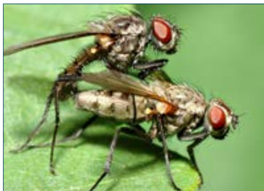
Рисунок 5. Размножение мух.

У личинок мух есть жевательные части рта и они потребляют любой гниющий органический материал в окружающей их среде. У взрослых мух существует часть рта для сосания (хоботок) и они должны потреблять пищу, которая уже находится в жидком состоянии, или может растворяться под воздействием их кислой слюны. Яйца и куколки мухи не питаются и выживают исключительно благодаря накопленной энергии 9 .