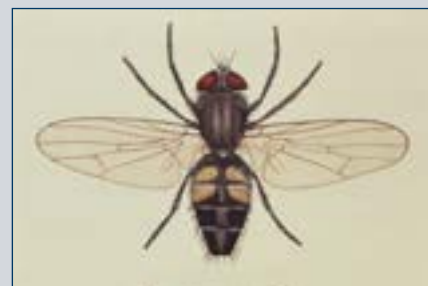
Рисунок 11. Малая домашняя муха.