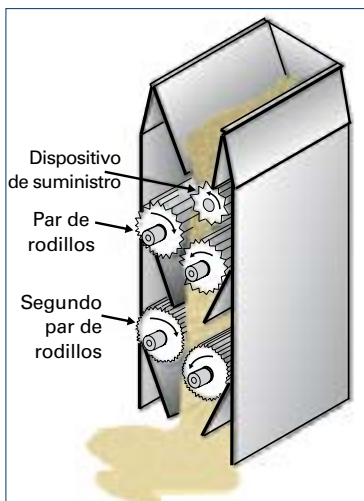
Figura 5. Molino de rodillos.

Los molinos de rodillos (Figura 5) utilizan rodillos cilíndricos, generalmente en pares para triturar (romper) el grano en partículas pequeñas. El alimento pasa a través de una serie de 2-6 pares de rodillos los cuales tienen una superficie ondulada o corrugada. Típicamente, un rodillo gira rápidamente y en la dirección opuesta para crear fuerza. El tamaño de las partículas es determinado por el número de rodillos, la distancia que los separa, la velocidad y el patrón de corrugación de la superficie. Generalmente, los molinos de rodillos muelen el grano en partículas de un tamaño más uniforme que los molinos de martillos (Figura 6).