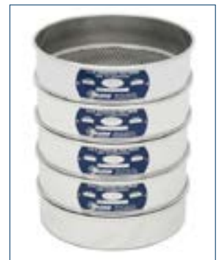
Figura 2. Tamizadores.