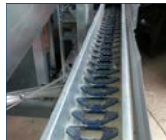
Figura 7. Alimentador tipo cadena.

Los sistemas de alimentación de tipo cadena (Figura 7) - distribuyen el alimento arrastrando el alimento alrededor del sistema por medio de cadenas. Los sistemas de cadena pueden separar las partículas de alimento por tamaño al mover el alimento. Las cadenas pueden moler el alimento al pasar por el sistema, aunque los nuevos sistemas de cadena minimizan este efecto. El movimiento lento de las cadenas puede ser problemático ya que las aves que están al inicio de la línea de alimento pueden seleccionar comer las partículas grandes.