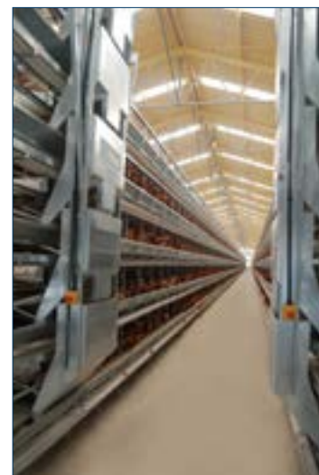
Figura 9. Alimentador tipo tolva el alimento expulsa el alimento directamente en el comedero.

El manejo de los comederos es importante para minimizar los efectos negativos de la separación de partículas y prevenir la acumulación de partículas finas. Las alimentaciones frecuentes en menores cantidades minimizan la acumulación de alimento fino. Los alimentadores tipo cadena generalmente entregan un gran volumen de alimento, haciendo posible la acumulación de partículas finas. El permitir que las aves limpien los comederos diariamente va a prevenir la acumulación de partículas finas. El asegurarse que haya espacio suficiente en los comederos para que todas las aves coman a la vez va a crear un consumo de nutrientes más uniforme en el lote.