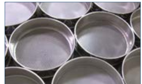
Figura 3. Se utilizan tamizadores de varios tamaños para separar una muestra de alimento triturado por el tamaño de las partículas.