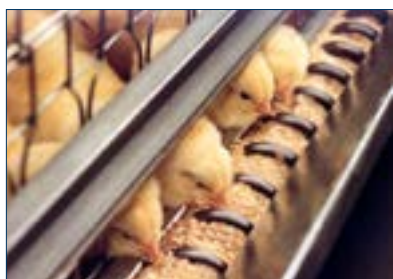
Figura 8. Alimentador tipo sinfin.

Los sistemas de alimentación tipo sinfin (Figura 8) - distribuyen el alimento por medio de un sinfin. El sinfin mueve el alimento con mayor rapidez con menor separación del tamaño de las partículas de alimento y muelen menos el alimento que los sistemas tipo cadena. Los sistemas sinfin generalmente entregan menos volumen de alimento en cada alimentación que los sistemas de cadena.